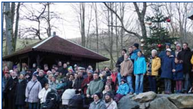
Kindergarten, Schule, Kerwejugend, Krabbeltreff, Ortsbeirat, Feuerwehr und TSV - alle, aber wirklich alle waren auf den Beinen, um ihr Dorf zu präsentieren

Nun war in dem 1400-Seelen-Dorf Hektik anstelle gemütlicher Weihnachtsfestlichkeit angesagt: "wenn die andern feiern" mußte eine eindrucksvolle Präsentation erstellt werden. Das HR-Team kam zum Dreh und nahm die interessantesten Plätze im Dorf auf, zusammen mit zahlreichen Einwohnerinnen und Einwohnern. Das war eine Meisterleistung der Dorfbewohner: fast jede Familie hatte Weihnachtsbesuch im Haus, der sich natürlich gern an der Präsentation beteiligte.